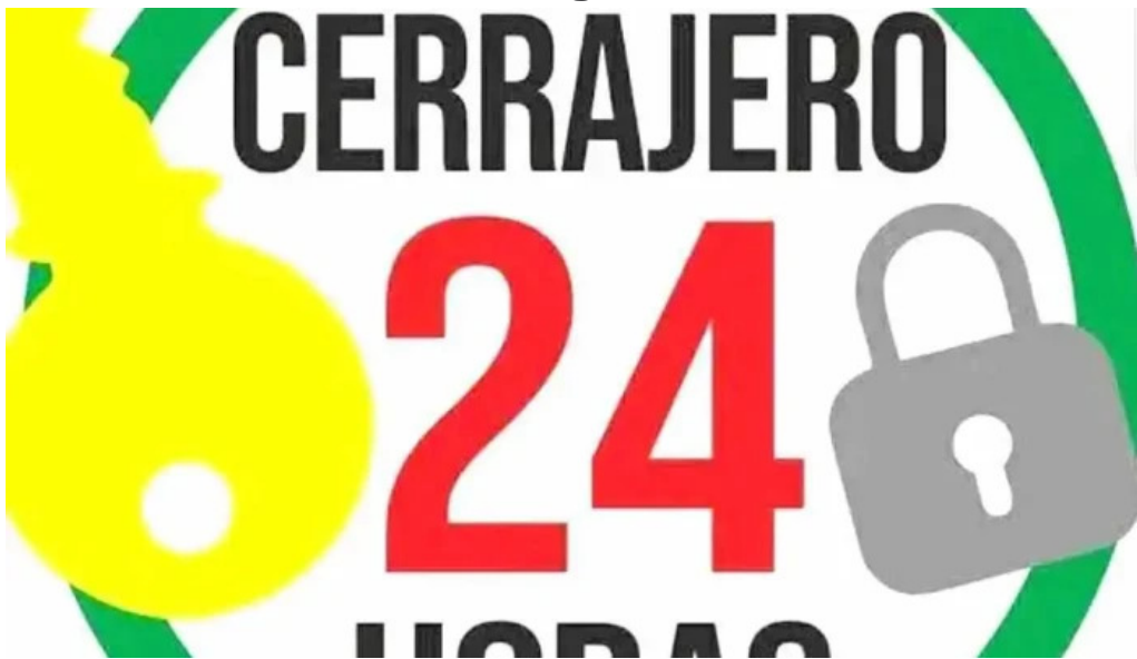
Cerrajero chihuahua cerca de mi solo aperturas mexico