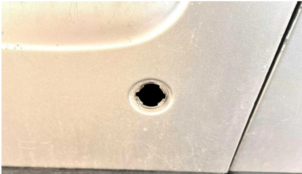
Cerrajero confianza durango