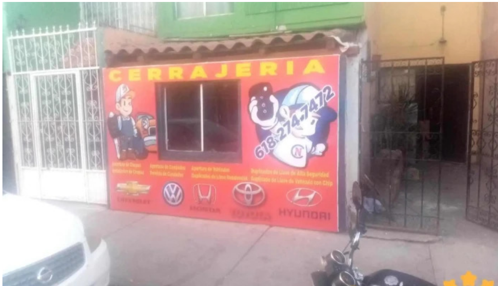
Cerrajero confianza instagram