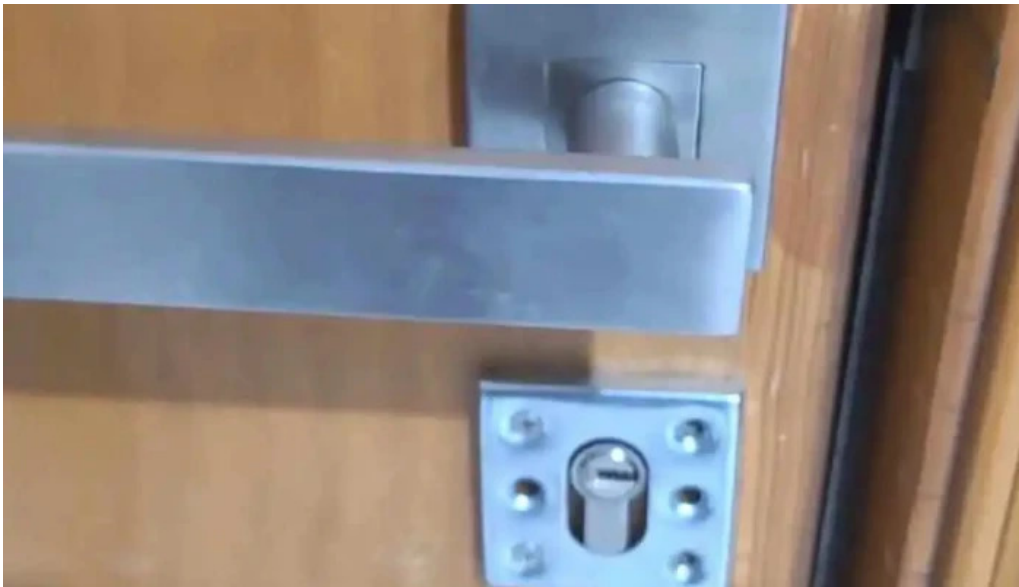
Cerrajero confianza mas recientes