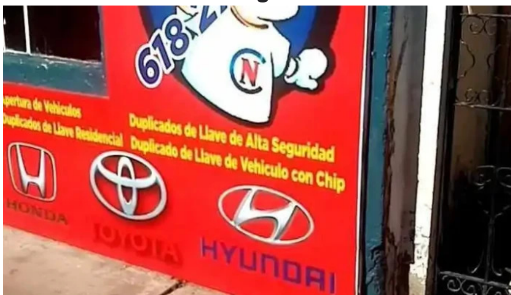
Cerrajero confianza videos