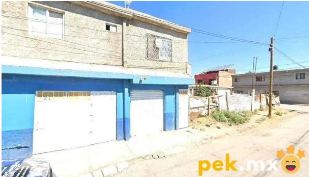
Cerrajería el roro durango