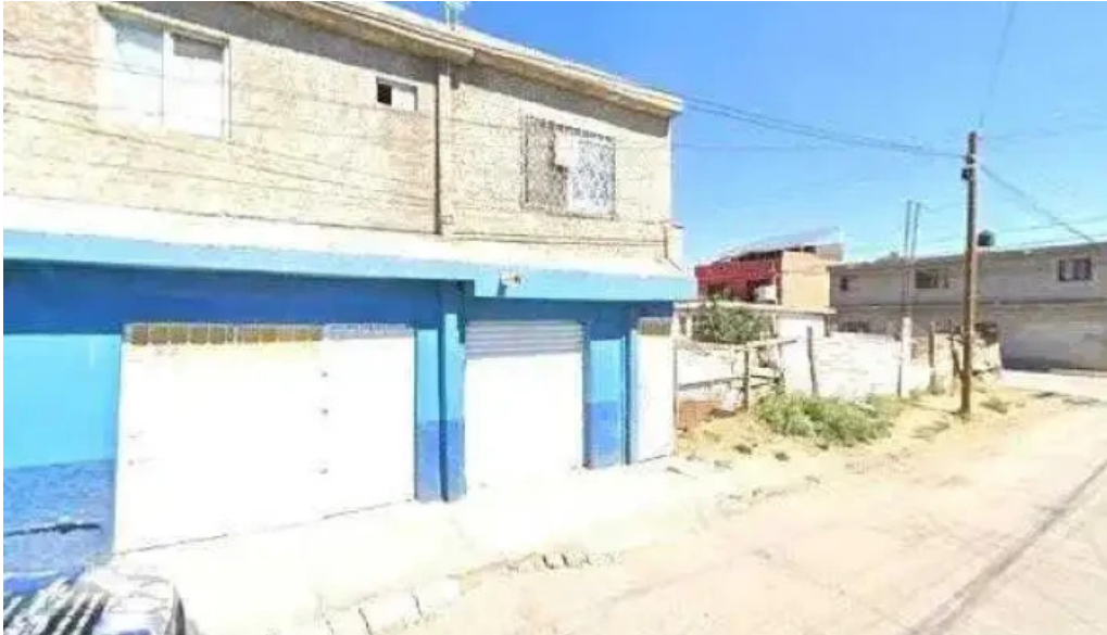
Cerrajería el rorro videos