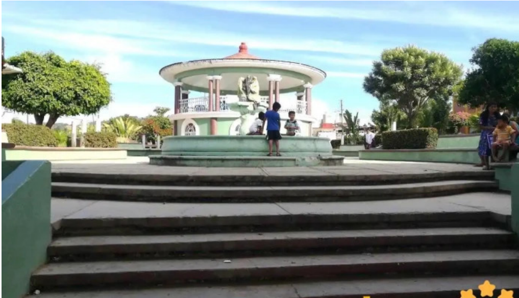
H ayuntamiento municipal huaxpaltepec san andres huaxpaltepec