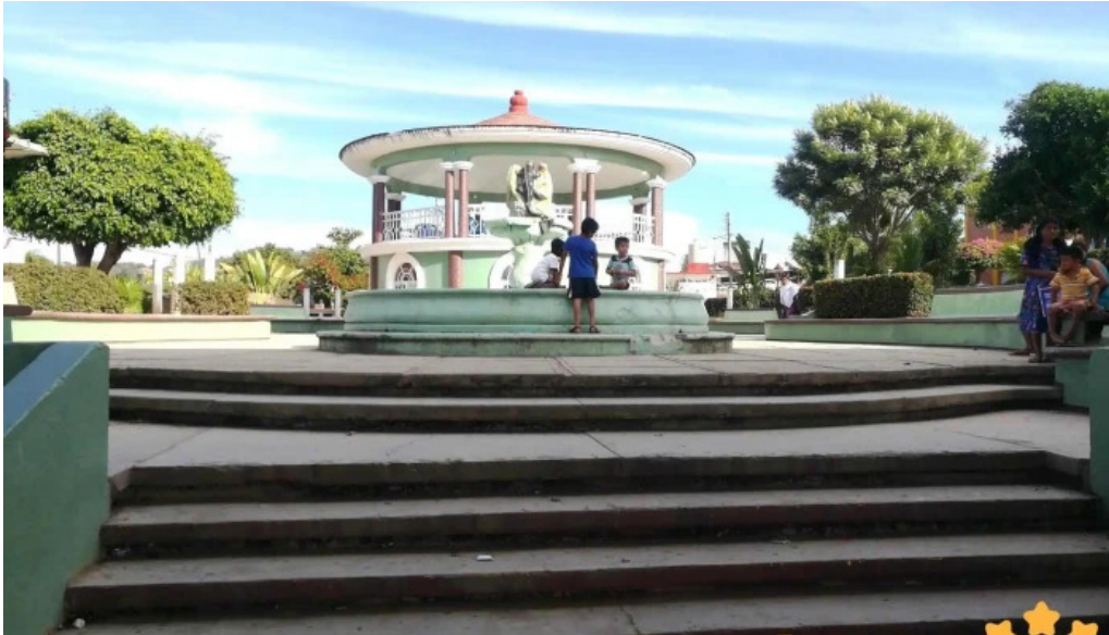
H Ayuntamiento municipal huaxpaltepec numero