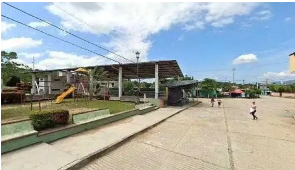
H ayuntamiento municipal huaxpaltepec numerodeg